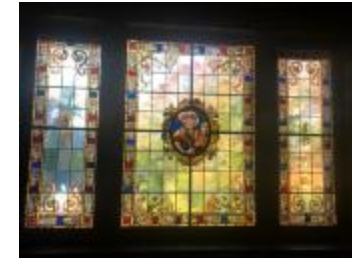
Driedelig glasraam voor de Heilige Hubertus (KSGR2021_012)