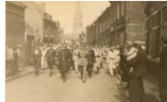
Collaborateurs en vermeende collaborateurs worden weggebracht door de witte brigade Izegem, 1944 (HV20160419_008)