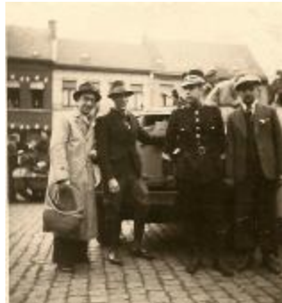
Bevrijding en repressie, Izegem, 1944 (HV20160419_004)