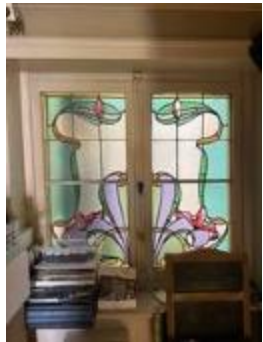
Vierhoekig glasraam met florale motieven (KSGR2021_016b)