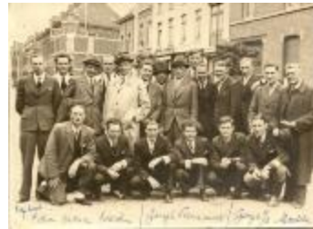
Vooraanstaande figuren bij de bevrijding, Izegem, 1944 of 1945 (HV20160419_009)