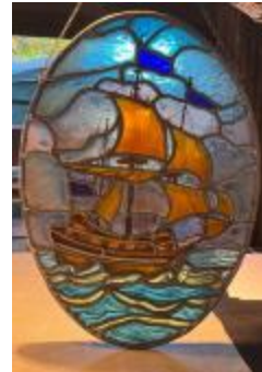
Ovalen glasraam met afbeelding van een schip (KSGR2021_022)