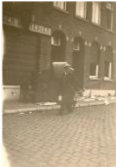
Plunderingen en vernielingen, Izegem, 1944 (HV20160419_007)