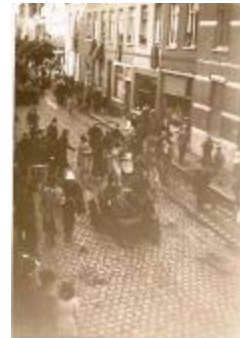
Poolse bevridders, Izegem, 1944 (HV20160419_001)