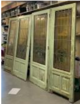
Scheidingswand bestaande uit vier deuren met glasramen (KSGR2021_028b)