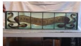
Rechthoekig glasraam met spreuk (KSGR2021_020c)