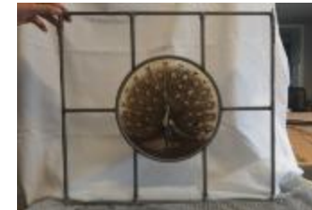
Rechthoekig glasraam met pauw (KSGR2021_020a)