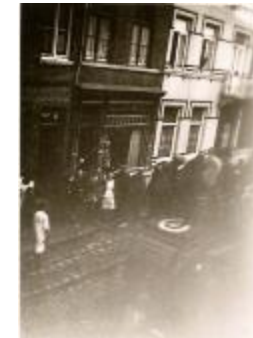
Poolse tank, Izegem, 1944 (HV20160419_002)