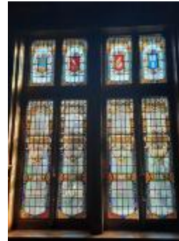
Veertiendeling glasraam, stadhuis Izegem (KSGR2021_013)