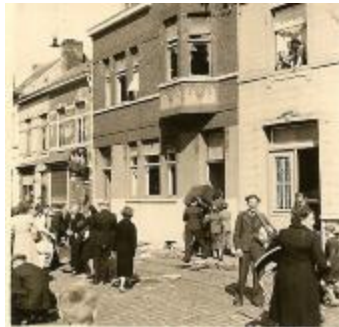
Plunderingen, Izegem, 1944 (HV20160419_006)