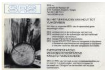
Publiciteit van SRS, Izegem, +/- 1985 (WD20150304_004)