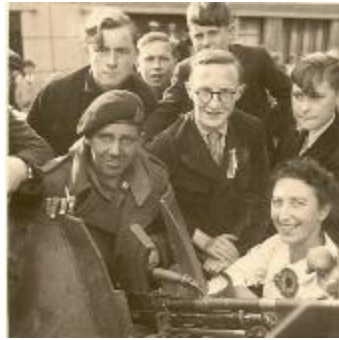
Izegem is bevrijd, Izegem, 1944 (HV20160419_005)