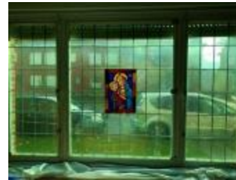
Rechthoekig glasraam met Maria en Jozef (KSGR2021_027a)