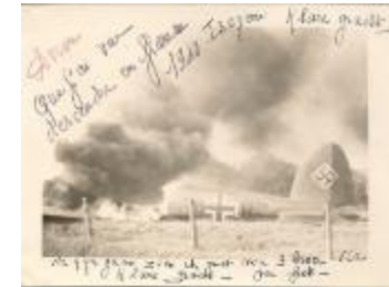
Wereldoorlog II, Izegem, 1940 (HV20160419_010)