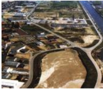
Hoek Lodewijk de Raetstraat met de Kaaistraat, Izegem, +/- 1985 (WD20150304_010)