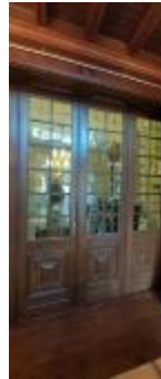
Scheidingswand met glasramen (KSGR2021_021b)