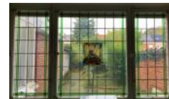
Rechthoekig glasraam met vrouw en spinnewiel (KSGR2021_027b)