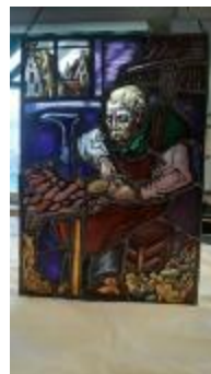
Rechthoekig glasraam met schoenmaker (KSGR2021_020b)