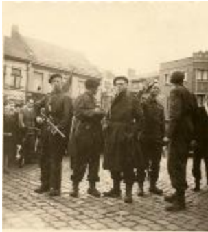
Bevrijders en verzetsmannen, Izegem, 1944 (HV20160419_003)