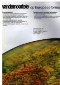
Publiciteit van Vandemoortele, Izegem, +/- 1985 (WD20150304_003)