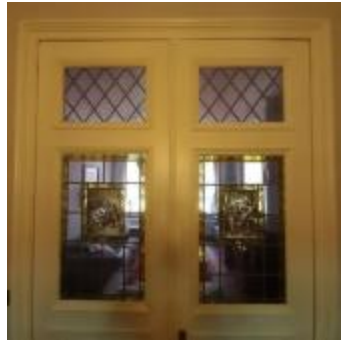
Rechthoekige glasramen gevat in 2 deuren met in het midden een afbeelding van Flor Coucke (KSGR2021_021a)