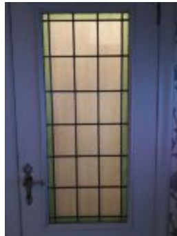
Rechthoekig glasraam met groene kader in deur (KSGR2021_024b)