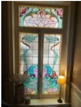
Rechthoekig glasraam met florale motieven (KSGR2021_016a)