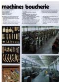
Publiciteit van Machines Boucherie, Izegem, +/- 1985 (WD20150304_005)