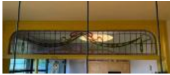
Rechthoekig bovenlicht met guirlande motief (KSGR2021_028a)