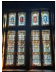
Veertiendeling glasraam, stadhuis Izegem (KSGR2021_013)