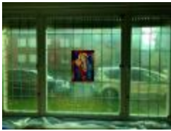
Rechthoekig glasraam met Maria en Jozef (KSGR2021_027a)