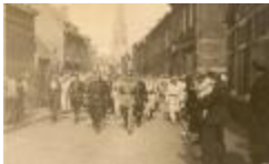
Collaborateurs en vermeende collaborateurs worden weggebracht door de witte brigade Izegem, 1944 (HV20160419_008)