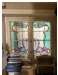
Vierhoekig glasraam met florale motieven (KSGR2021_016b)