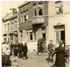
Plunderingen, Izegem, 1944 (HV20160419_006)