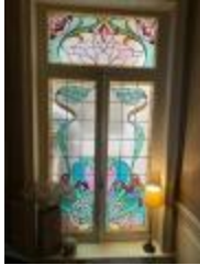
Rechthoekig glasraam met florale motieven (KSGR2021_016a)