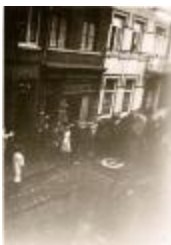
Poolse tank, Izegem, 1944 (HV20160419_002)