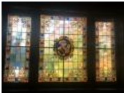
Driedelig glasraam voor de Heilige Hubertus (KSGR2021_012)