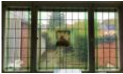
Rechthoekig glasraam met vrouw en spinnewiel (KSGR2021_027b)