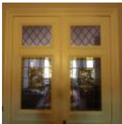
Rechthoekige glasramen gevat in 2 deuren met in het midden een afbeelding van Flor Coucke (KSGR2021_021a)