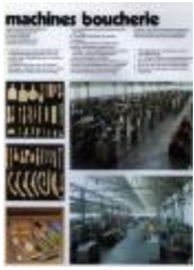
Publiciteit van Machines Boucherie, Izegem, +/- 1985 (WD20150304_005)