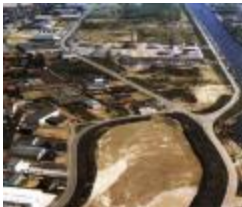
Hoek Lodewijk de Raetstraat met de Kaaistraat, Izegem, +/- 1985 (WD20150304_010)