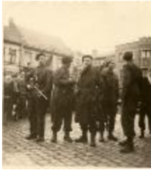
Bevrijders en verzetsmannen, Izegem, 1944 (HV20160419_003)