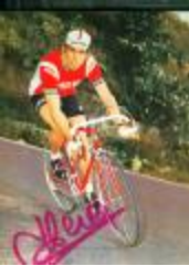
Patrick Sercu, Izegem, 1964-1983 (WD20160406_022)