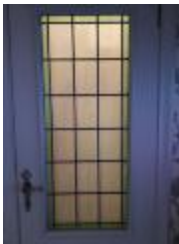
Rechthoekig glasraam met groene kader in deur (KSGR2021_024b)