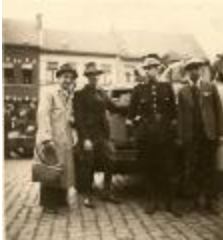
Bevrijding en repressie, Izegem, 1944 (HV20160419_004)