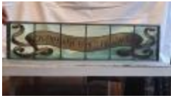
Rechthoekig glasraam met spreuk (KSGR2021_020c)