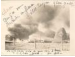
Wereldoorlog II, Izegem, 1940 (HV20160419_010)