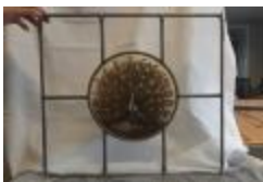
Rechthoekig glasraam met pauw (KSGR2021_020a)