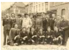
Vooraanstaande figuren bij de bevrijding, Izegem, 1944 of 1945 (HV20160419_009)