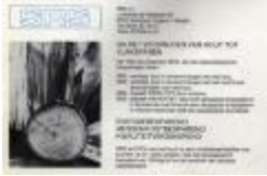
Publiciteit van SRS, Izegem, +/- 1985 (WD20150304_004)