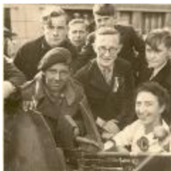
Izegem is bevrijd, Izegem, 1944 (HV20160419_005)