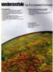
Publiciteit van Vandemoortele, Izegem, +/- 1985 (WD20150304_003)