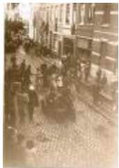
Poolse bevrijders, Izegem, 1944 (HV20160419_001)