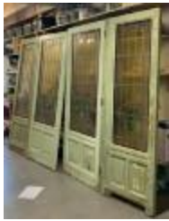
Scheidingswand bestaande uit vier deuren met glasramen (KSGR2021_028b)