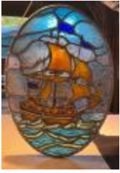
Ovalen glasraam met afbeelding van een schip (KSGR2021_022)