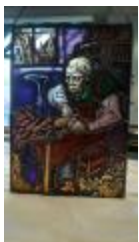
Rechthoekig glasraam met schoenmaker (KSGR2021_020b)