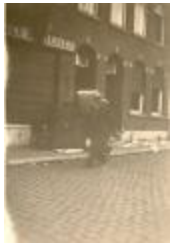
Plunderingen en vernielingen, Izegem, 1944 (HV20160419_007)