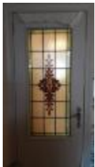
Rechthoekig glasraam in deur met plantmotief (KSGR2021_024a)