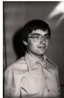
Man poseert, Moorslede 1976 (PV2013_089-10)