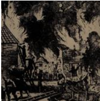
Pentekening brand, +-1700 (BCR2013_0105_0001)