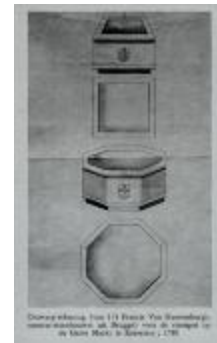
Ontwerptekening van steenput op Grote Markt Roeselare, 1781 (BCR2013_0005_0001)