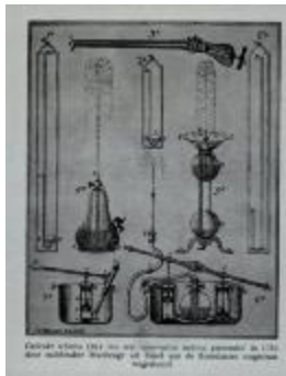
Gedrukt schema van 'constructio anthica prementis' door Maubeuge, 1784 (BCR2013_0006_0001)